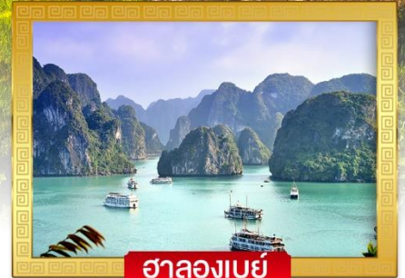
ฮาลองเบย์