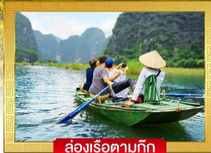
ล่องเรือตามก๊วก